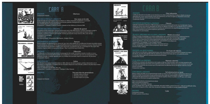
Interior del álbum

Archivar como: Electronica, Experimental Rock, Industrial, Arte Sonoro, Avant-Garde, Electro-acoustic