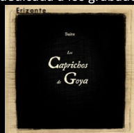
"Suite Los Caprichos de Goya"

- Se trata de la segunda parte de la Trilogía de Erizonte dedicada al dibujo en los medios de comunicación como transmisores de ideales progresistas, teniendo como primera parte la dedicada a los grabados de Goya en la